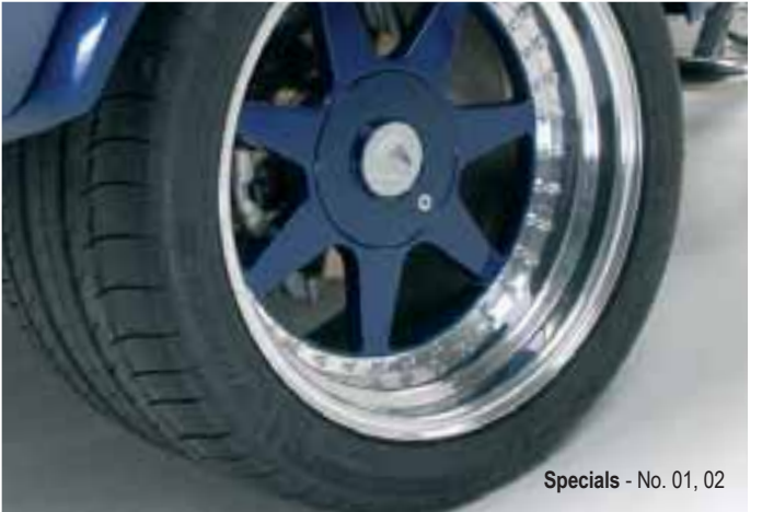
Specials - No. 01, 02