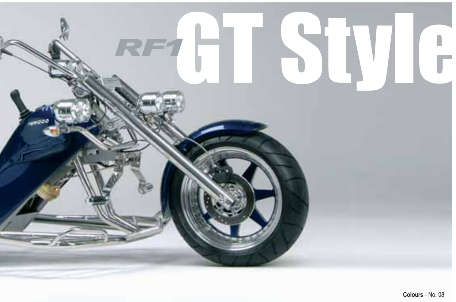
Colours - No. 08