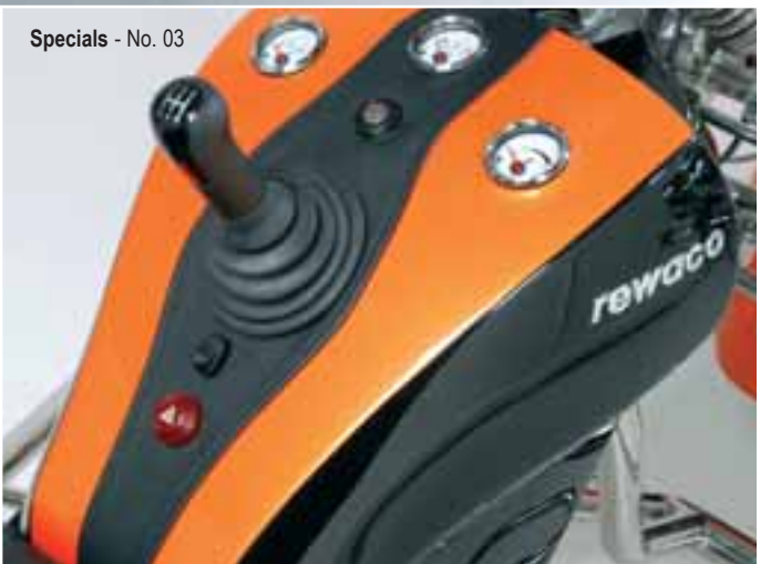
Specials - No. 03