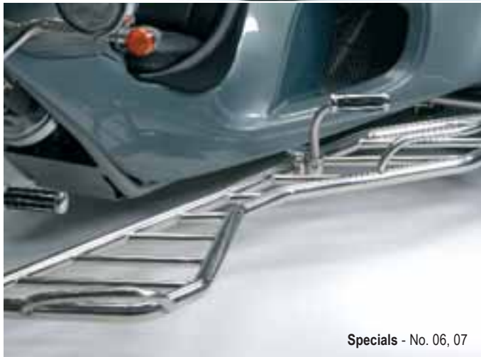
Specials - No. 06, 07