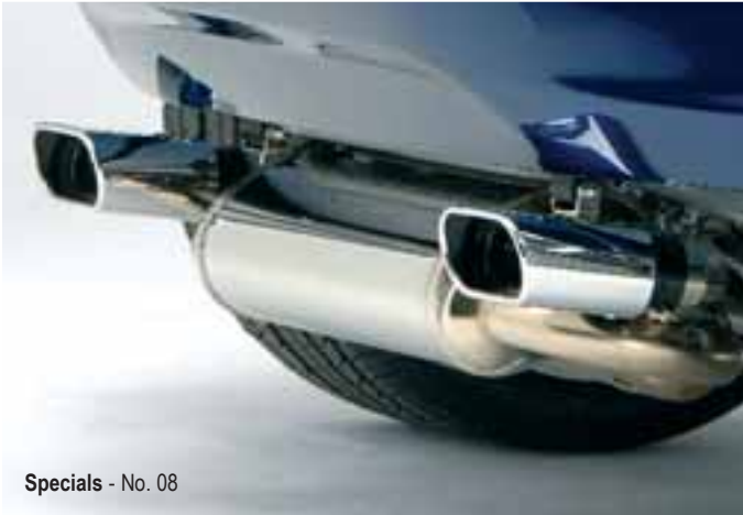
Specials - No. 08