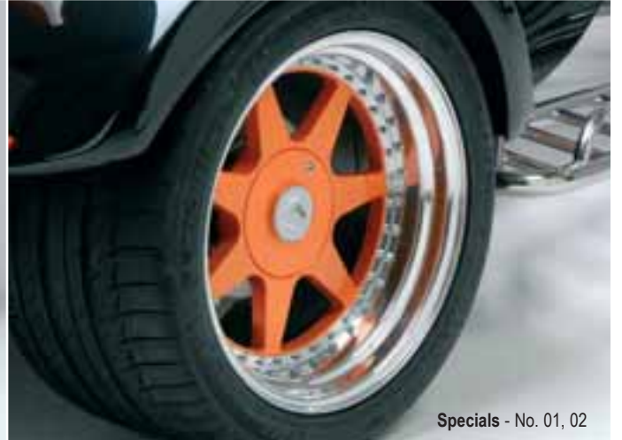
Specials - No. 01, 02