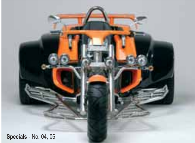
Specials - No. 04, 06