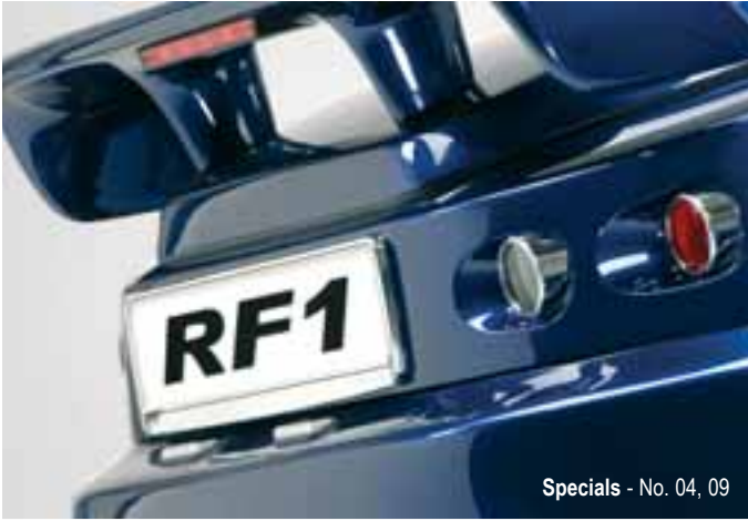
Specials - No. 04, 09